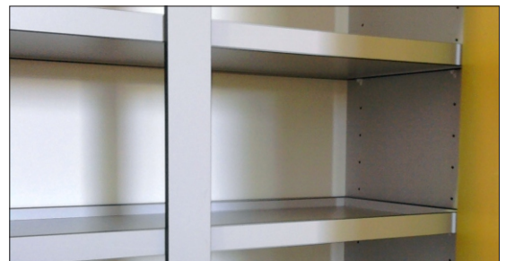
Prateleiras anti-derrame em compacto fenólico