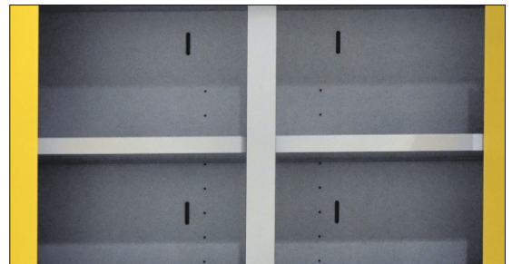
Saídas de ar nas costas do armário