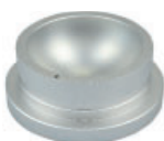
LBM009 Adaptador matraces f/redondo 500 mL