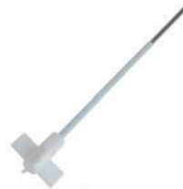
Varilla agitación en cruz Referencia LLF006 6.5x35 cm, PTFE