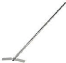
Varilla agitación Referencia LLF005 9x40 cm, inoxidable