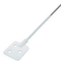
Varilla agitación paleta Referencia LLF008 7x35 cm, PTFE