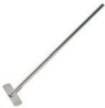
Varilla agitación recta Referencia LLF003 6x40 cm, inoxidable