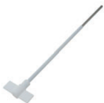
Varilla agitación recta Referencia LLF007 7x35 cm, PTFE