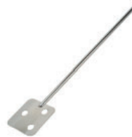
Varilla agitación paleta Referencia LLF004 7x40 cm, inoxidable