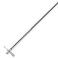
Varilla agitación en cruz Referencia LLF002* 5x40 cm, inoxidable * incluida con los equipos