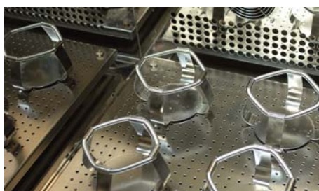
[02] Adaptadores, permiten que cada usuario configure las cámaras según sus necesidades. The holders allows the user making up the incubators according to their own necessities.