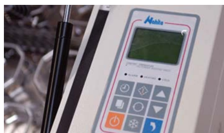
[01] Display para el control de la velocidad, temperatura y tiempo. Display to programm the operation speed, temperature and time