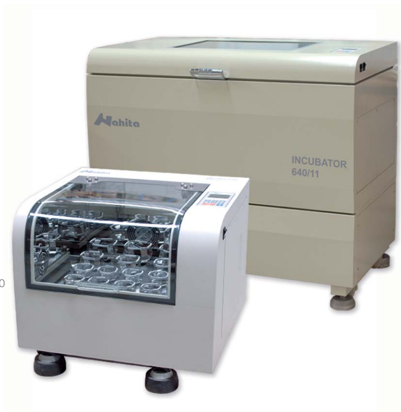
[01] Referencia: 50640010 Code: 50640010